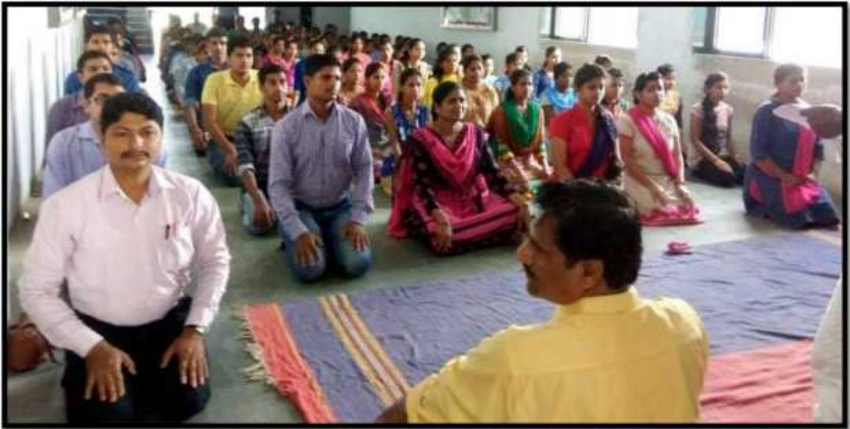
Swachatta Abhiyan (College Campus )