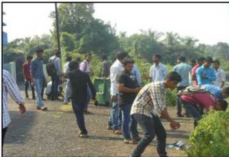
Swachatta Abhiyan (Alibag Beach)