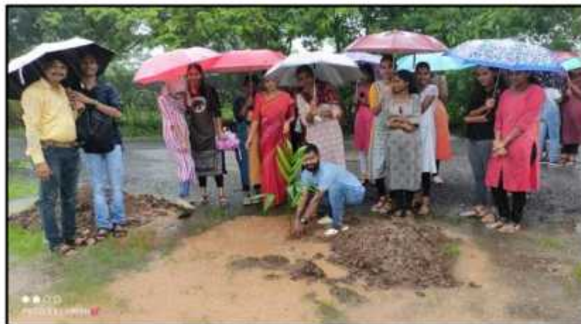
Tree Plantation (10 June 2017)